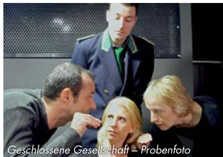
Geschlossene Gesellschaft – Probenfoto

Das 1954 gegründete Kellertheater zog 1966 in das Haus Karl-Muck-Platz 1, seit 1997 Johannes-Brahms-Platz 1. Während das Ensemble inzwischen aus circa 90 Mitgliedern besteht, umfasst das ständige Repertoire 10 bis 15 Stücke: hauptsächlich modernes Literatur-Theater, aber auch Klassiker, Musicals, Kindertheater und Lesungen.