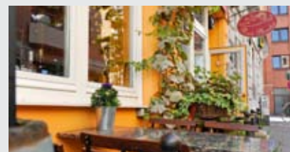
Piccolo Paradiso Brüderstraße 27, 20355 Hamburg

Weit mehr als nur Pasta! Seit Jahren ist das „Piccolo Paradiso“ eine feste Adresse für kreative Bio-Küche vom Allerfeinsten. Die Gäste erwartet ein vegetarischer, teils auch veganer wöchentlich wechselnder Mittagstisch. Von Rote-Beete-Feta-Quiche bis zu Süßkartoffel-Kokos-Suppe findet man hier alles, was außergewöhnlich und lecker ist. Auch Weine aus garantiert ökologischem Anbau runden die Karte ab. Einlass in das „kleine Paradies“: Mittags Di–Fr von 12–15.00 Uhr und abends Di–Sa ab 18.00 Uhr.