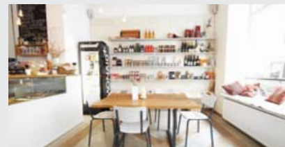
Hej Papa Poolstraße 32, 20355 Hamburg