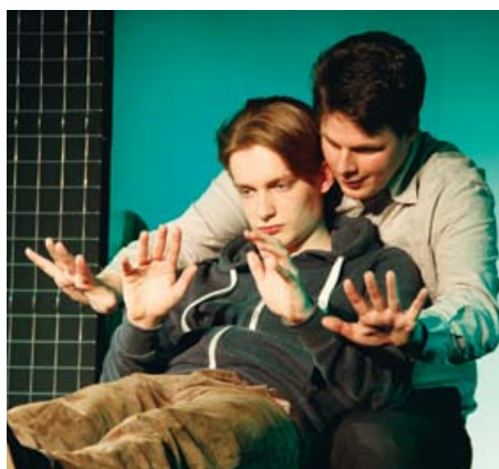
Szene aus „Einer wie Kaspar Hauser“